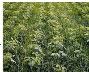
第4図 湿害後の雑草繁茂

密条播栽培は、大豆の早期繁茂によって初期雑草を抑えるのがねらいであるが、大豆播種前の既存雑草及び大豆の草丈を上回る大型雑草等の防除は困難である。したがって、播種前及び生育中期の茎葉処理除草剤を適宜使用する。