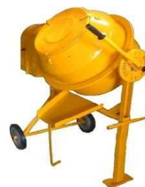
第1図 種子消毒剤用ミキサー

紫斑病防除のために種子の消毒を行う。ハト類による発芽時食害を回避する効果のある薬剤、殺虫効果のある薬剤もある。