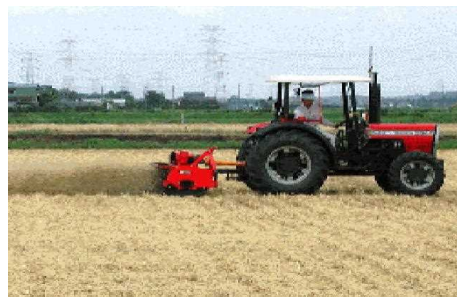
第5図 フレールモアによる麦稈細断

高い刈り株や多量の麦稈は播種作業の支障になり、大豆の徒長や出芽不良を起こしたり、麦わらの下になった雑草の除草が困難となるので、フレールモア等を用いて細断・拡散を行う（第5図）。