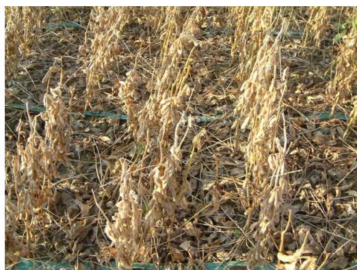
[適湿区：完全に落葉]

生育初期の湿害は根域が浅くなり、開花～着莢期の夏期高温乾燥期に水分不足が起こりやすく、落花、落莢の増加により青立ちが発生する(第7図、第4表)。