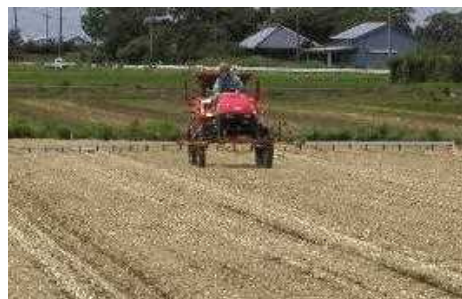
第6図 ブームスプレーヤーによる雑草防除

不耕起栽培では、除草剤により播種前に繁茂している雑草の防除が必要である。非選択性除草剤を播種前に規定量散布する（第6図）。