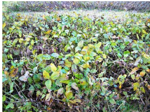
[無防除区：落葉悪く青立ち]