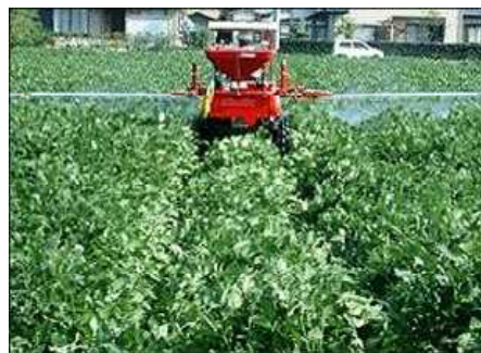
第9図 ブームスプレーヤー防除

密条播栽培は、畦幅が狭く茎葉が繁茂するため、畦間が分かりづらいことから、ブームスプレーヤーで防除を行う場合は、作業機の踏みつけや巻き込みによる損傷が生じやすい（第9図）。対策として、播種時や繁茂量の少ない生育期除草剤の散布時に作業機の走行路を設定し、以後その走行路を継続して利用すれば、子実害虫防除の作業がしやすく、損傷も少なくなる。