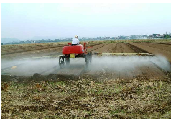
第3図 土壌処理剤散布

大豆の雑草防除は、播種直後の土壌処理剤と中耕培土の組み合わせによって行うのが基本である（第3図）。また、既存雑草が多い場合は、播種前、耕起前に使用可能な茎葉処理剤もある（第4図）。土壌処理剤は碎土が良好で土壌が適度に湿っているときに最も効果が高くなる。土壌水分が多い場合や砂質土壌では薬害が出やすいので薬量、希釈水量共に基準量の少ない方へ、逆に土壌が乾燥している場合は基準量の多い方へ合わせる。また、土壌処理剤の持続期間は20～30日程度であり、その後中耕培土を行うが、作業が梅雨期のため適期を逃した場合は、イネ科・広葉それぞれに登録のある選択性茎葉処理剤を使用する。イヌホオズキ、帰化アサガオ類などが占有している圃場では非選択性茎葉処理剤を使用する。この場合、大豆に飛散しないように畦間に局所散布する。