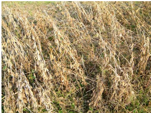
[防除区：完全に落葉]

莢、子実肥大期に適切な害虫防除を怠った場合、落莢、粒肥大阻害により青立ちが発生する(第6図、第3表)。