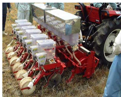
第2図 全農三菱方式不耕起播種機

播種作業において、慣行栽培はロータリー等で耕起、整地し播種を行うのに対して、不耕起栽培は耕起していない圃場に直接播種溝を切り種子を播く方法である（第2図）。また、完全な不耕起ではないが、播種直前まで不耕起で播種時に軽く浅耕しながら播種する半不耕起と、播種条の部分のみ10cm程度の中耕する部分耕も広義の不耕起栽培としてここでは取り扱う。