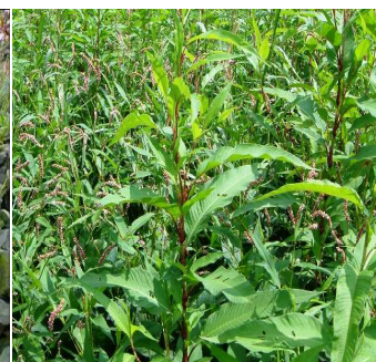
第8図 オオイヌタデ