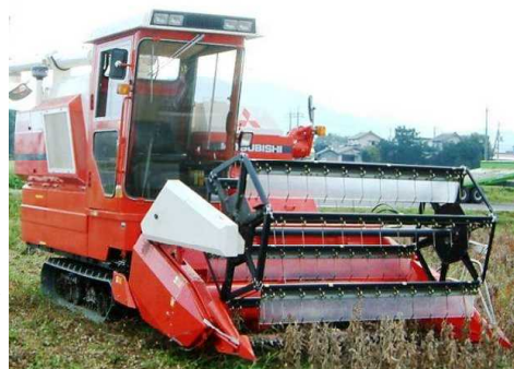
第8図 コンバイン収穫

成熟期は、ほ場全体のほとんどが落葉し、茎や莢が変色し軽く振ると子実がカラカラ音をたてる時期である。収穫が早過ぎると茎汁等による汚損粒や破砕粒が発生しやすく、遅れると自然裂莢による収穫ロスやしわ粒が多くなり、降雨、積雪により機械作業日、時間が限定されるので、品質と収量を向上させるためには、適期を逃さず収穫することが必要である。コンバイン収穫前には、必ず青立ち株や大型雑草を除去し、汚損粒の発生防止に努める。成熟当初の茎水分は70%前後と高く、そのままでは茎の汁により汚損粒が多発するので、茎水分が40～50%以下（手で折るとポキッと折れる状態）になった時期が刈り取り適期である。刈取りは、朝露が完全に乾く午前10時～午後5時の日中に行うようにする。