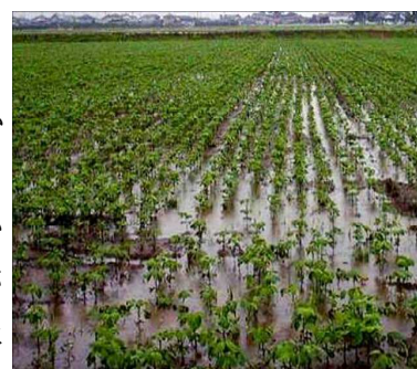
第3図 降雨による滞水

不耕起栽培は、「湿害が発生しない技術」との誤った認識から、基本的な排水対策を省略して栽培する例があり（第3図）、生育不良により雑草が繁茂し大きな減収や栽培放棄といった事例もある（第4図）。中耕培土による除草、排水効果が期待できない不耕起栽培は、弾丸暗きよ、明きよ等の営農排水を慣行栽培と同程度に確実に実施する必要がある。