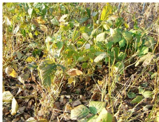
[初期過湿+開花期過乾処理区：落葉悪く青立ち]