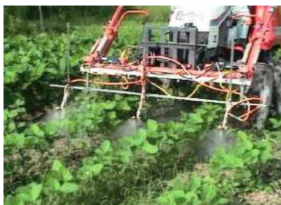
第4図 茎葉処理剤畦間散布