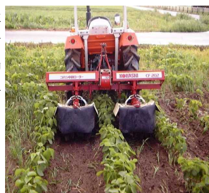
第5図 トラクター用中耕機

中耕・培土は雑草防除、土壌の通気改善、排水性の向上による湿害防止、不定根発達の促進による干ばつ回避、倒伏軽減など多くの効果があり、大豆の安定多収栽培には欠かすことのできない作業である（第5図）。中耕・培土は2回程度行う。管理機やトラクター装着カルチで、1回目は第2複葉展開期（播種後約20～25日）に子葉節まで培土し、2回目は第5複葉展開期（播種後約30～35日）に第1複葉節まで培土する。収穫機の作業性を考え、最終培土の畦高さを20cm程度にとどめ、均一にする。また、2回目の培土は適期が遅れると大豆を傷めて逆効果となるので、開花始めまでに終える。麦跡等の晩播栽培（6月下旬～7月上旬）では開花までの期間が短くなるので、第3～4複葉展開期（播種後約25～30日）に1回行う。