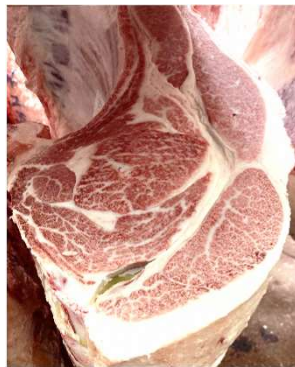
安福久-平茂勝-福栄、去勢 枝重555.6kg、ロース芯 88cm 2 、 BMSNo.12