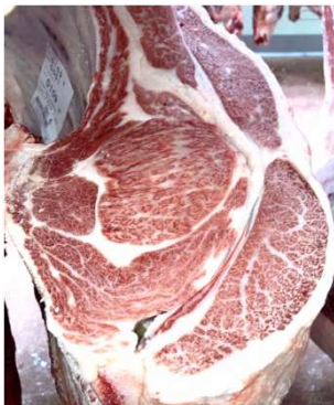
美国桜-美津照重-北茂勝96、去勢 枝重582.8kg、ロース芯 110cm 2 、 BMSNo.12

※育種価(令和6年5月評価)の順位は、島根県で評価した全国の種雄牛393頭中の順位 ※総合評価は、枝肉重量：脂肪交雑：ロース芯を1：2：1の重み付けでの評価値