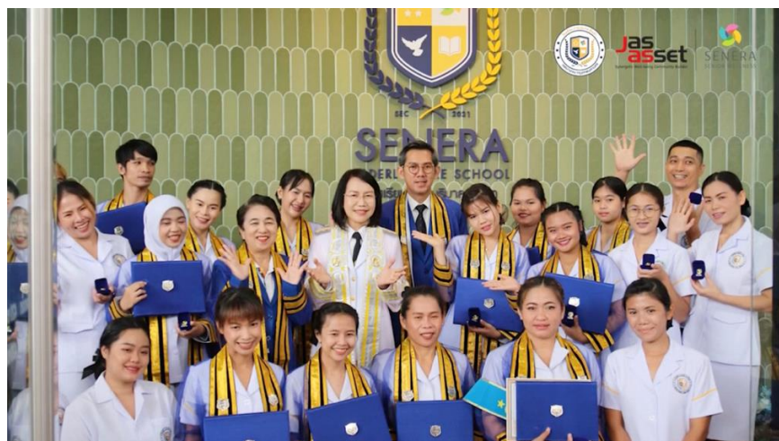
セネラ介護士養成学校の卒業生

介護職に興味がある方なら、性別、年齢、国籍にかかわらず、すべての方が、コースを受講し、介護士認定資格を取得いただけます。