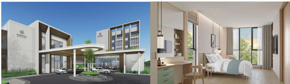
高齢者用介護施設「セネラ・シニア・ウェルネス」の雰囲気