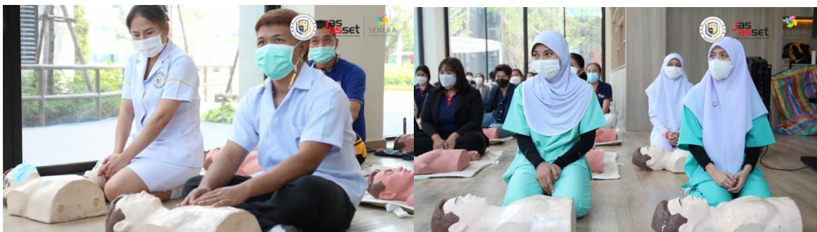
セネラ介護士養成学校のクラスの雰囲気

弊社は高齢者の生活の発展と幸福を願っています。昨今、高齢者人口が大幅に増加しているため、高齢者の日常生活や病気療養期をサポートできる介護士を養成し、高齢者が幸福で質の高い生活を送れるようサポートしたいと思いました。また、当校では緩和ケア（Palliative Care）を学べるコースを準備しています。このコースで学ぶ生徒たちは、高齢者が最期を迎える日まで、各段階にふさわしい介護方法を学び、少しでも身体的・精神的苦痛を和らげるようサポートします。