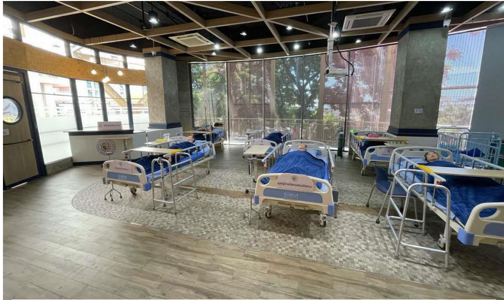
セネラ介護士養成学の校内の雰囲気

当校のカリキュラムはタイ教育省と保健省の認定を受けている点に加え、系列の介護施設で学生たちは学んだことを実践できます。また、カリキュラムの学習時間を柔軟に設定できます。これらは当校の強みです。