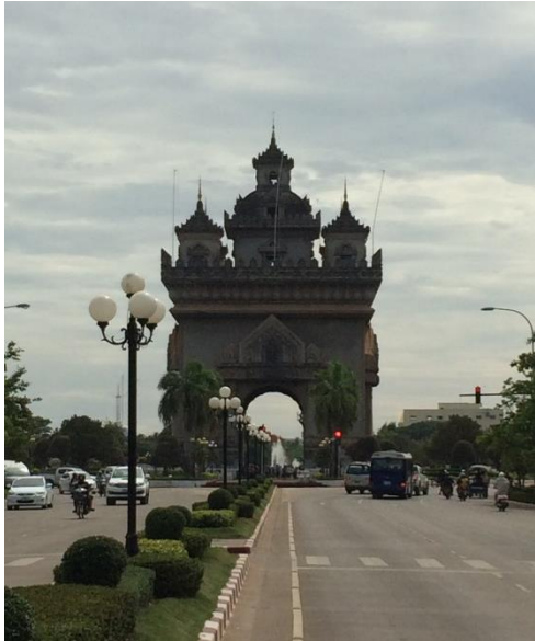
ラオス パトゥーサイ（凱旋門） パリの凱旋門を模して作られた。ラオス語でパトゥーとは「扉」「門」の意味、サイとは「勝利」の意味である。戦没者の慰霊碑として1960年に建設されたもの

ほとんど高層ビルがありません。アセアンのどの国より通行する車が少ない印象です。また、フランス統治下の影響が町並みに残っています。