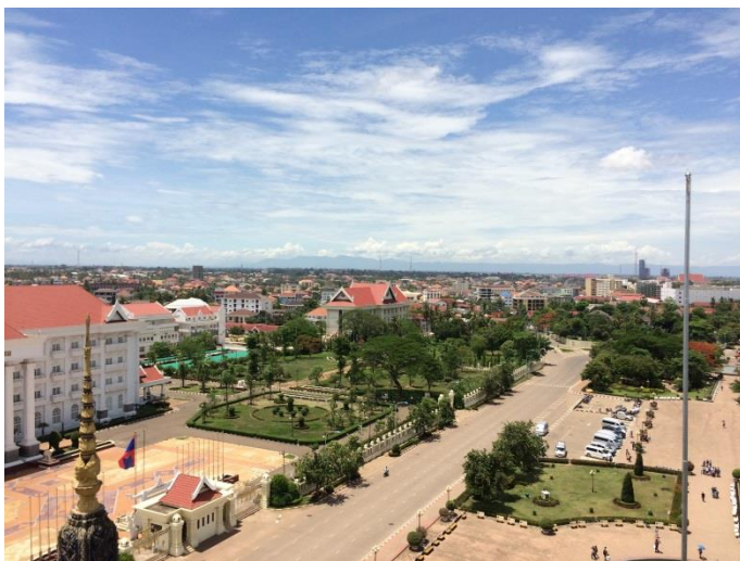
凱旋門から見たビエンチャン市内