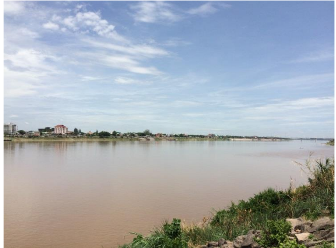
メコン川 東南アジア最長の川全長4,350km、中国のチベット高原に源を發し、ミャンマー、ラオス、タイ、カンボジア、ベトナムを流れる。タイ・ラオス南部では川幅が14kmにも達する。