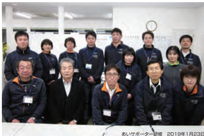
あいサポーター研修 2019年1月23日

「誠実・謙虚・感謝」を経営理念として、人材育成を最重点にしています。創業から退職者を出すことなく、順調に推移しています。