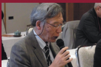
〈坂本先生〉景気に左右されずに成長を続ける企業に共通する「人を大切にする経営」について学びます。