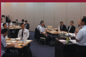
経営者から、いかに社員の力を引き出し強い会社にしていくか具体的な話を聞きます。