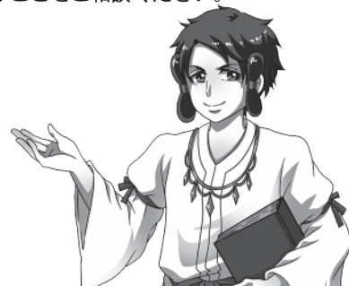
島根県労働委員会キャラクター ラルコス