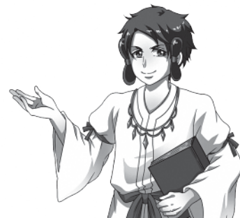
島根県労働委員会キャラクター ラルコス