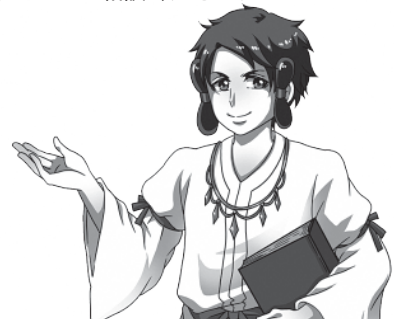
島根県労働委員会キャラクター ラルコス