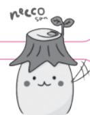
根っこの妖精 「ねっこさん」