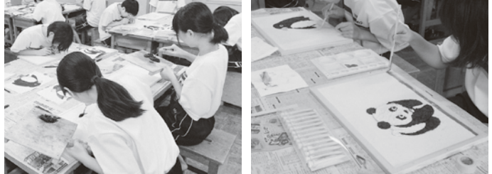
左官「漆喰コテ絵製作」

島根県 (TEL 0852-22-6556) 島根県技能士会連合会 (TEL 0852-23-1707)