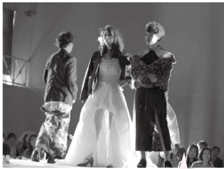
<ステージパフォーマンス(美容科)>