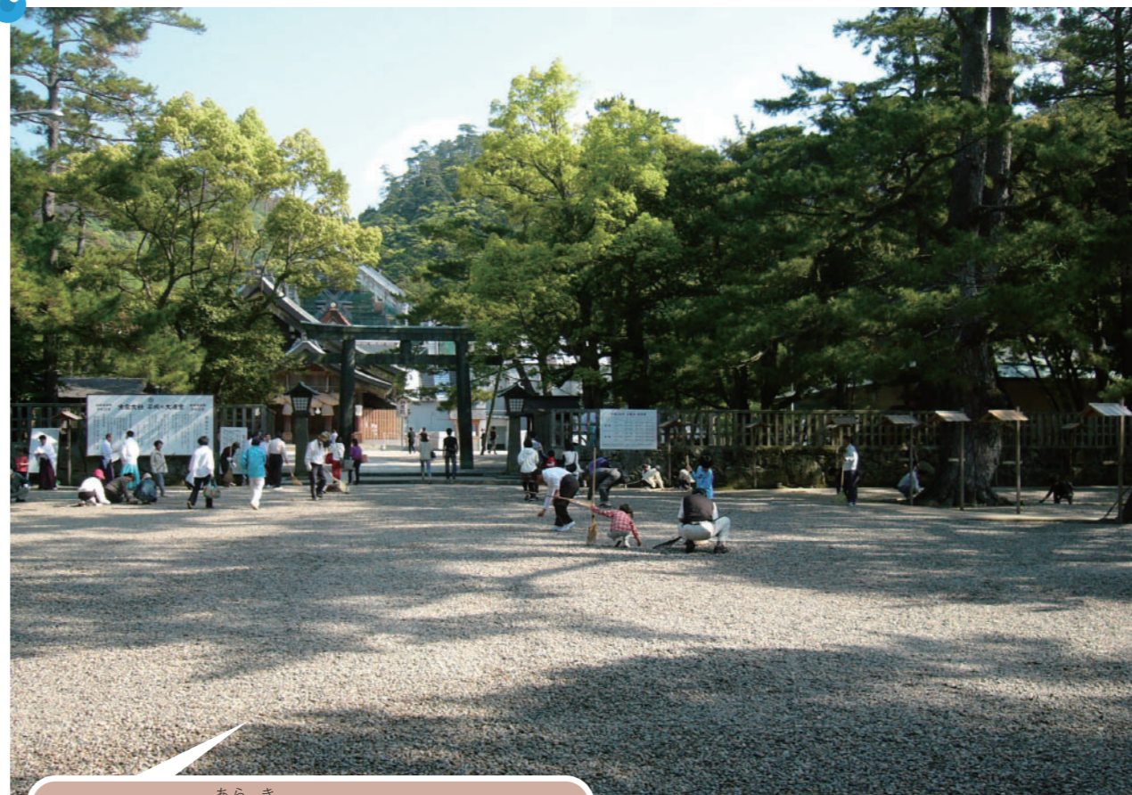
あらき 出雲市立荒木小学校 5月6日(日)朝8時30分からの境内一斉清掃に参加し、バレン(熊手)で落ち葉を集めました。子どもの数は少なかったですが、その中で一生懸命きれいにしていました。