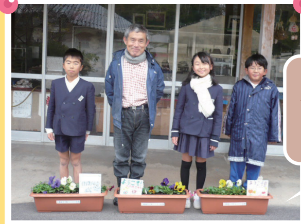
ひのみさき 出雲市立日御碕小学校 日御碕灯台のお店にプランターをおいてもらいました。