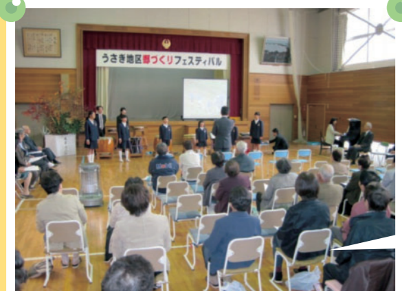
うさぎ 出雲市立鶴鷺小学校 学校行事を地域とともに開催し、日ごろの学習の成果を発表することで、子どもたちの元気を地域に届けています。