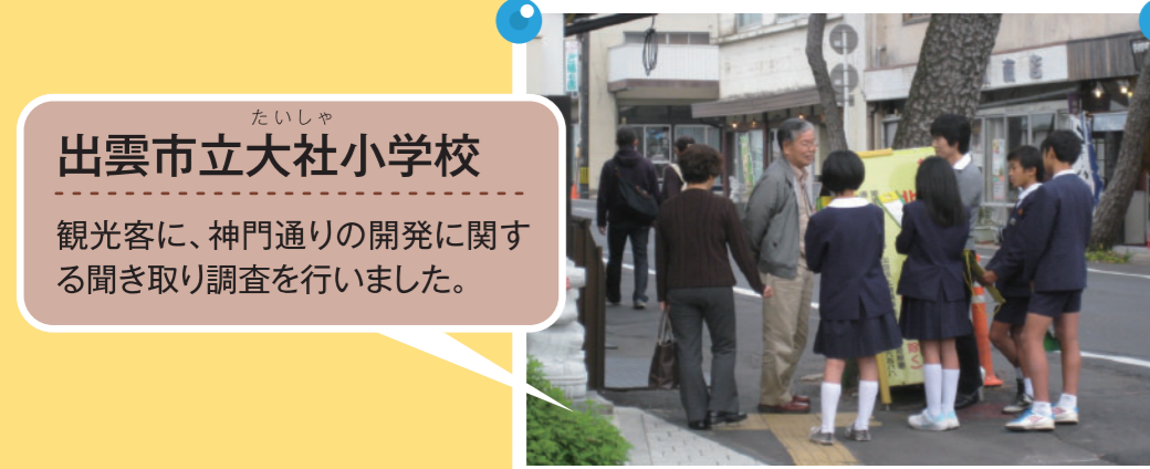
たいしゃ 出雲市立大社小学校 観光客に、神門通りの開発に関する聞き取り調査を行いました。