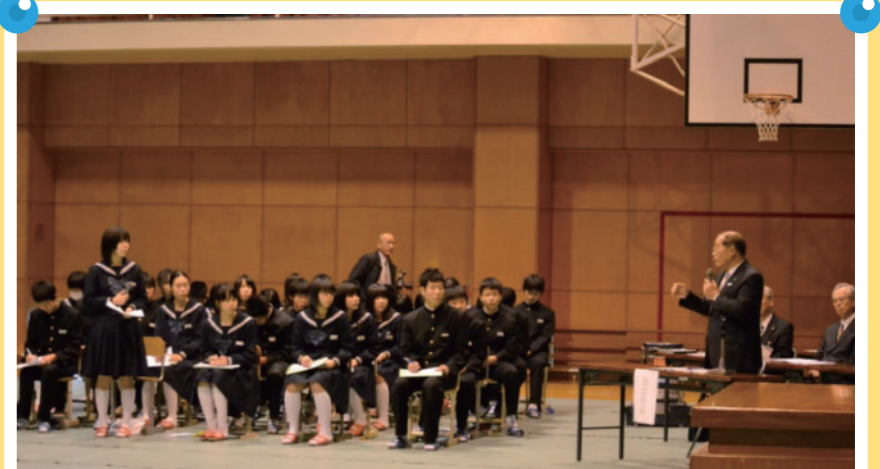
たいしゃ 出雲市立大社中学校 市長と共に、出雲市の未来について語り合いました。

出雲市大社地域の学校では、「子ども・若者公民館活動」を展開し、地域でのあいさつ運動やおもてなし運動、伝統文化を受け継ぐ活動、観光ガイドボランティア活動などの「地域貢献活動」などとともに、地域の大人と一っしょに、地域の将来を考える活動をなどに取り組んでいます！