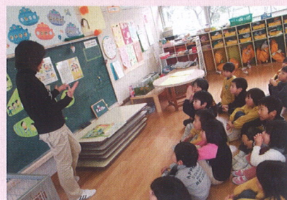
<出雲市立平田幼稚園>