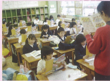
＜安来市立荒島小学校＞