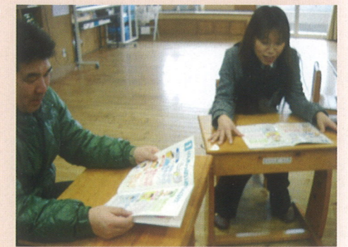
＜安来市立南小学校＞ ※ 学級懇談会で活用