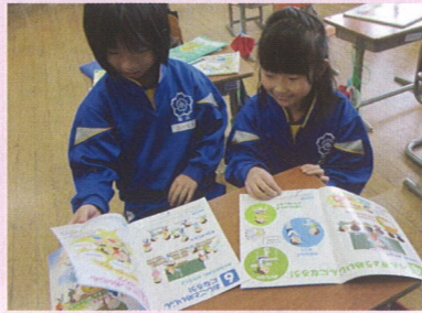
＜江津市立桜江小学校＞