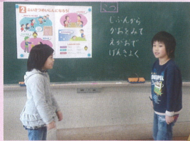
＜松江市立古志原小学校＞