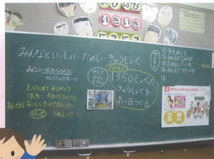
＜雲南市立阿用小学校＞ ※ 栄養士の訪問にあわせて活用