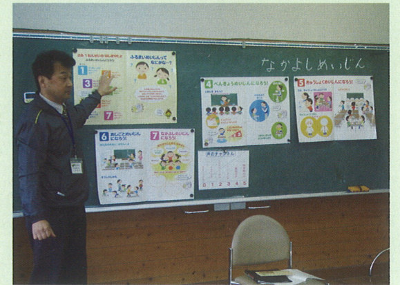
＜奥出雲町立三沢小学校＞ ※ 町教育委員会の社会教育主事をゲストティーチャーに招いて活用