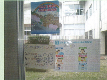
＜益田市立安田小学校＞ ※ 昇降口に掲示して全校児童や保護者に啓発