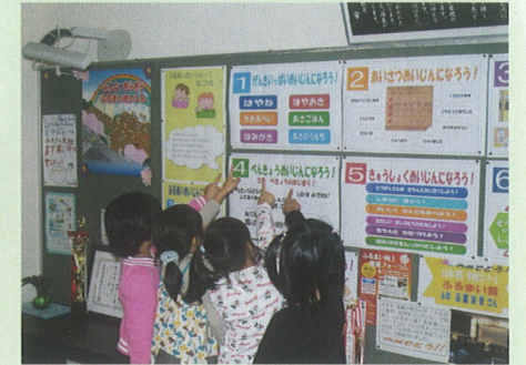
＜松江市立秋鹿小学校＞ ※ 全校啓発用に学校独自の資料を作成し、昇降口前に掲示

○ 学校が月ごとに取り組む生活目標と関連する内容の箇所を拡大コピーして、全校で活用する。