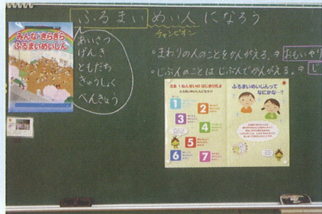
＜松江市立母衣小学校＞