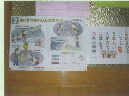
＜松江市立乃木小学校＞ ※ 「げんきなあいさつをしよう」と全校児童へ啓発