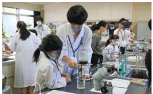
キッズサイエンスプログラム