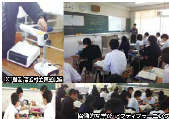
ICT機器 普通科全教室配備

卒業後の進路は、大学・短大などへ進学し、さらに専門的で深い教育を受ける人や、資格取得を目指して専門学校等に進学する人、就職して実社会に踏み出していく人など様々です。