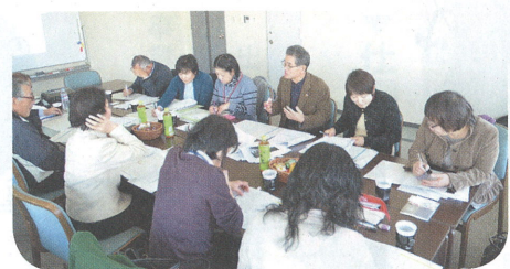
はぴこ同士の情報交換会

つ、条件だけでは分からない相性も考えて探します」と話し、出会いの可能性が広がるように心がけているといいます。