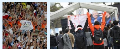
過去大会のライブサイト・競技会場での観戦の様子 (イメージ)