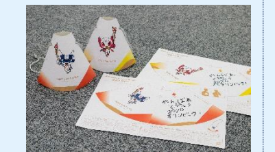
東京2020聖火リレー応援メガホン (イメージ)