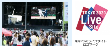
東京2020ライブサイト ロゴマーク