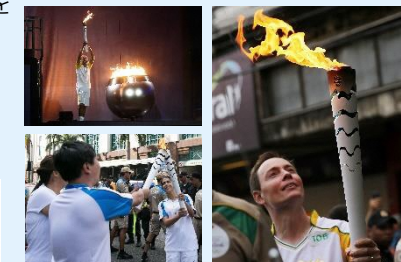
過去大会の聖火リレーの様子 (イメージ)