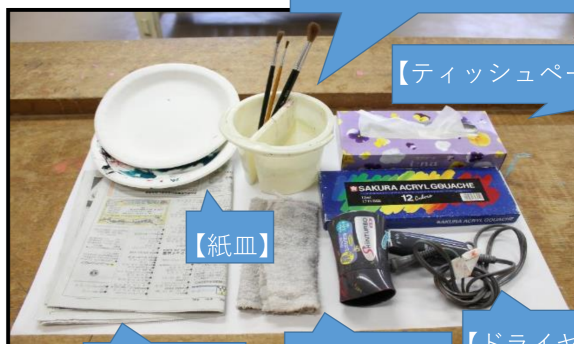
【アクリル絵の具セット】