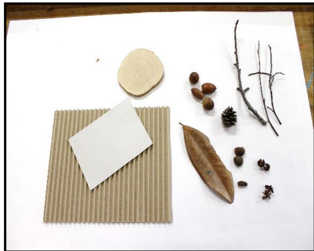
【段ボール、型紙、土台となる木、木の実、枝、葉など】