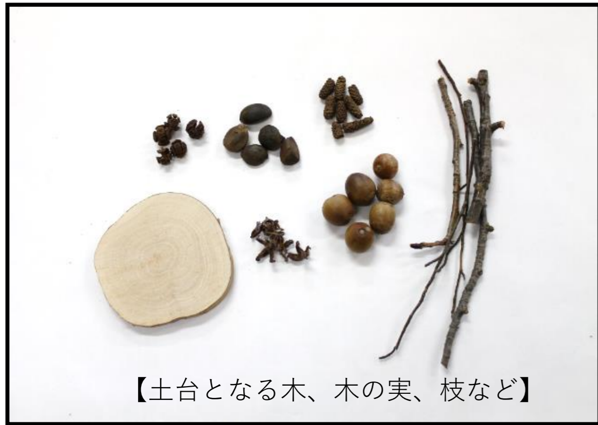
【土台となる木、木の実、枝など】