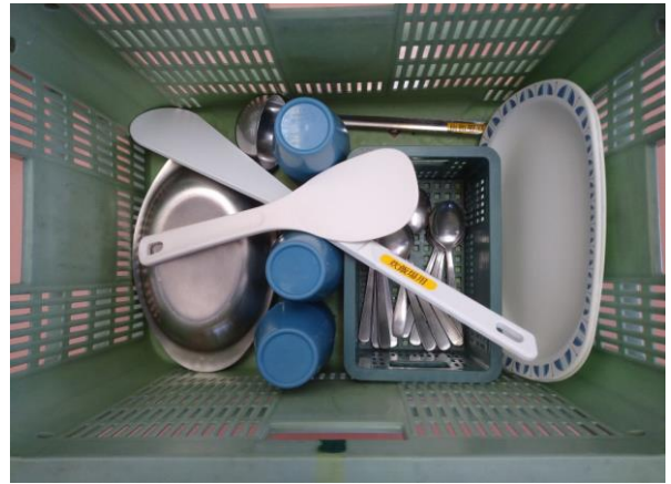
数を確認して食器を入れましょう