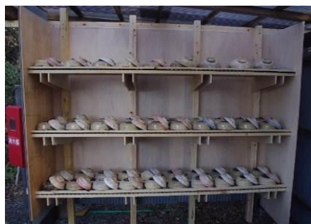
ソロ炊飯用土鍋置場

第2炊飯場では、かまどは各団体で下写真のようにつくってから調理をします。(耐火レンガ使用) カレーやバーベキューを戸外でしたい方にお勧めです。