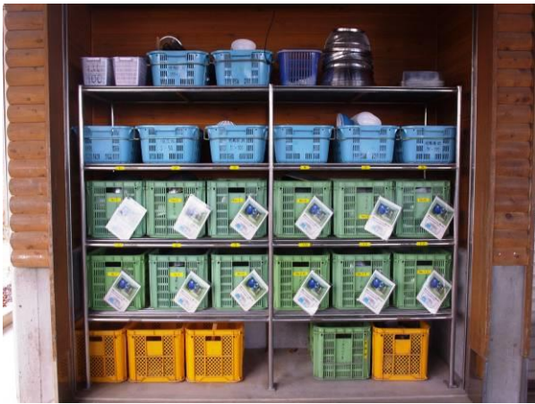
BQ用食器とカレー用食器一式(12班分)があります