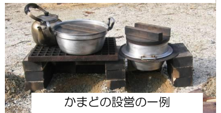
かまどの設営の一例

第2炊飯場では、かまどは各団体で下写真のようにつくってから調理をします。(耐火レンガ使用) カレーやバーベキューを戸外でしたい方にお勧めです。