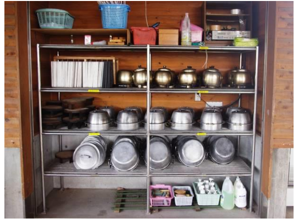
水を切るようにふせます