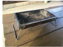
バーベキュー台(小)