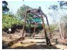
21 明日へのジャンプ