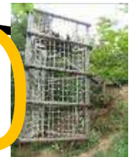
6 大木での危機 ※網の内側を伝って下りましょう。