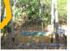
8 尾根飛び (木の国へ)