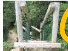
3 赤猪岩下り ※雨でぬれている時は、すべりますので、使えません。