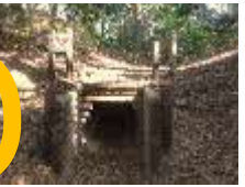
4 近道の洞窟 〔マムシ等の事前確認〕