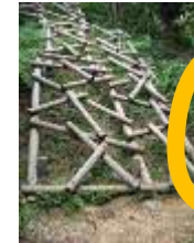
7 丘越え (木の国へ脱出) 〔指導者配置が望ましい〕