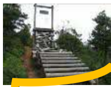
14 山越え (オオクニヌシに逢いに)