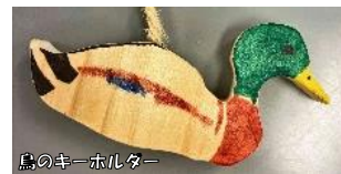
鳥のキーホルダー