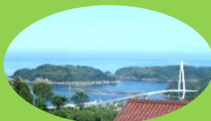
3階から見えるマリン大橋