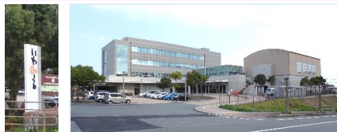
<いわみーる全景> 3階にセンターの事務室があります