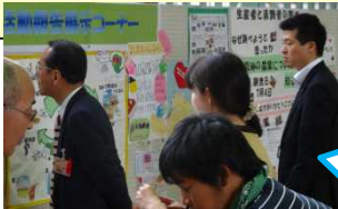
市長さん(右)、教育長さん(左)も、熱心に参観されていました。

公民館での学びを地域ビジネスにつなげようという取組や、小学生が地域の方と育てた野菜を益田市内の保育所の給食に届ける取組など、学びをきっかけに地域を元気にするヒントがたくさんありました。