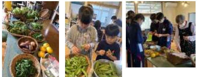
『午後の学びの時間（味噌づくり）』