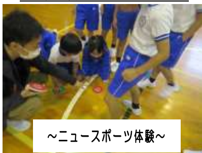
～ニュースポーツ体験～