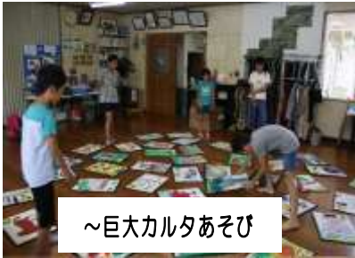
～巨大カルタあそび

吉賀町では、島根県が推進している「結集！しまねの子育て協働プロジェクト事業」の放課後支援（放課後子ども教室）を、町が進めている教育の核“ サクラマスプロジェクト ”になぞらえ、「放課後サクラマス教室」と銘打って、毎月1回程度小学生を対象に取り組んできました。これまでに、蔵木地区・朝倉地区・柿木地区で開設し、実践してきましたが、今年度から六日市地区・七日市地区でも開設し、全小学校区にて実施する体制が整いました。