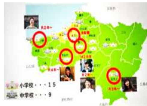
図2 5つのCSと社教CNの配置