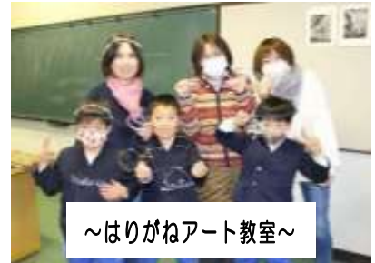
～はりがねアート教室～