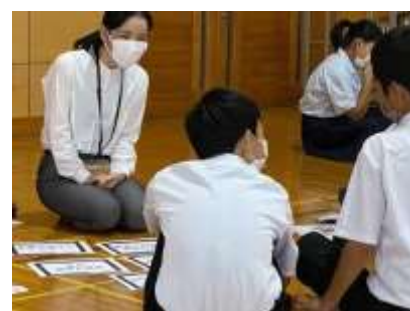
高津中学校 「イキカタツカン」の様子

今後もライフキャリア教育を進め、多様な人が子どもたちとつながるための取組を推進していきたいと思っています。