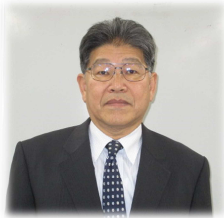
【調整監】 上部証司 ★人事・任用・服務 (5701)