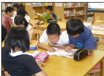
図書館での年鑑の指導