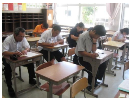
教員を生徒に見立てた模擬授業