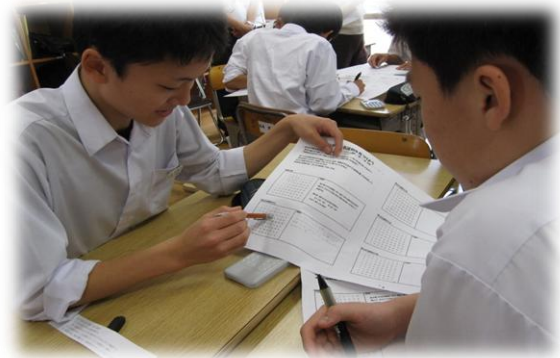
個人の思考を学習グループ で伝え合う様子（三隅中）

ここでは、各実践校の取組をいくつかの視点でまとめています。各学校においてスーパースクール実践校の事例を参考とし、新しい学習指導要領の趣旨を踏まえた取組が積極的に推進されますようお願いします。