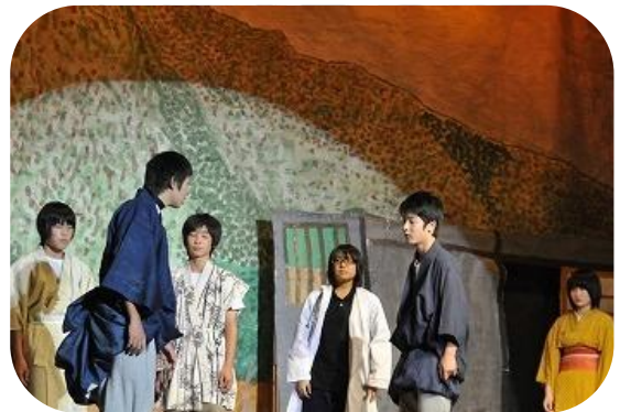
オリジナル演劇上演の様子