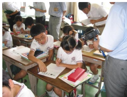
ペアで問題を考えている様子