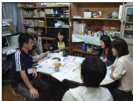
ワークショップ型授業研究