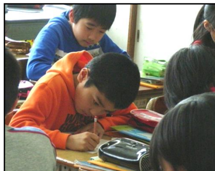
自分の考えをワークシートに書く場面