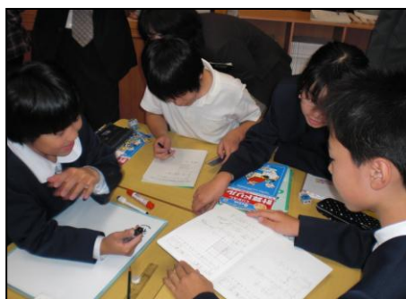
ミニホワイトボードを活用したグループでの学び合い（城北小）