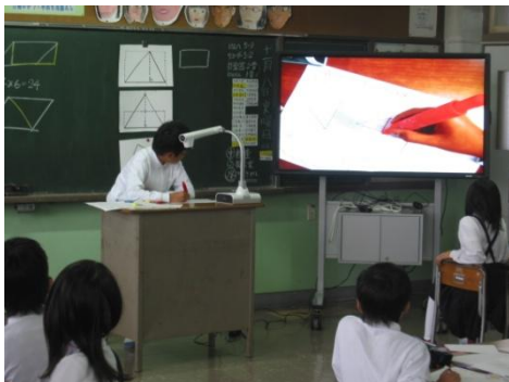
書画カメラと電子黒板を活用した授業実践の様子