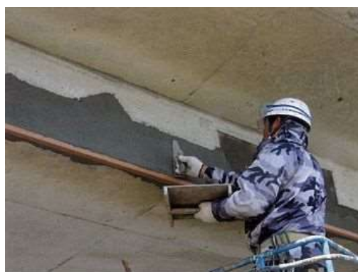
写真4-3 断面修復状況