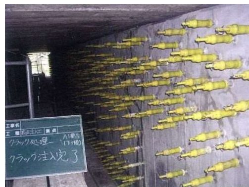
写真4-2 ひび割れ注入状況

ひび割れを塞ぐことにより、劣化因子(水分、塩化物など)の侵入を防止しコンクリートの耐久性を向上することができます。