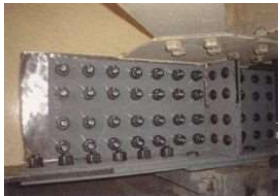
写真4-1 当て板工実施状況