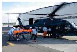
被災者等空輸のイメージ (防衛省災害対処に係る訓練より)