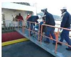
住民避難のイメージ (国民保護共同訓練より)