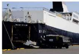
救援物資・車両の搭載 (防衛省災害派遣時の写真)