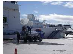
被災地での給水支援 (海上保安庁災害対応の写真)