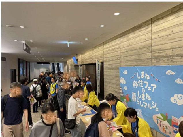
開場を待つ行列の様子