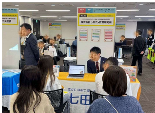
企業の担当者から会社概要等の説明を受ける学生・若手社会人の様子