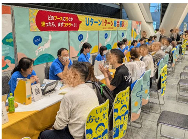
定住財団総合相談ブースが満席の様子