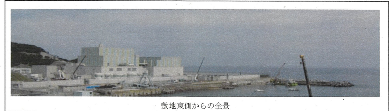
敷地東側からの全景