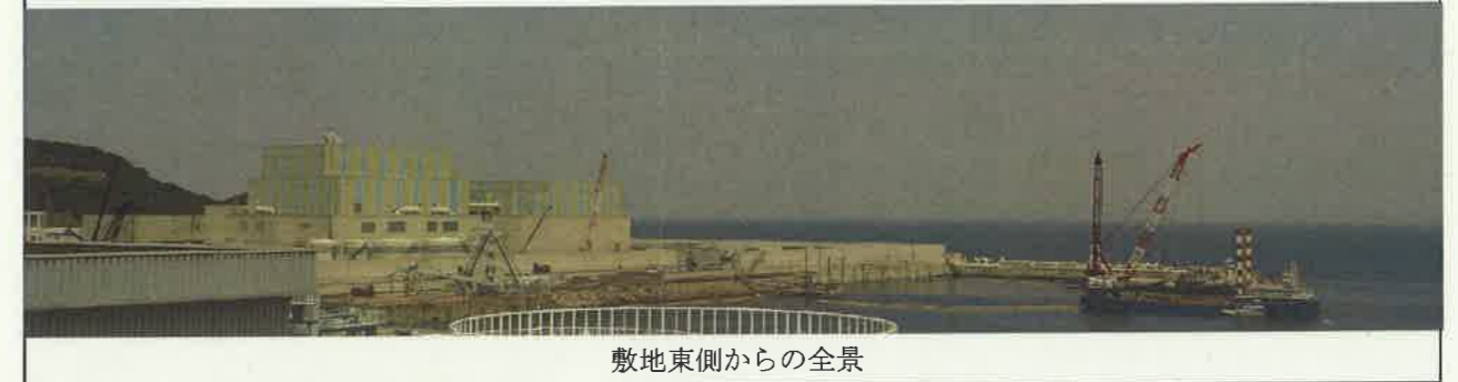
敷地東側からの全景