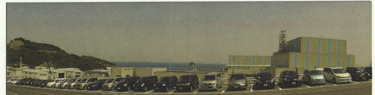
敷地南側からの全景