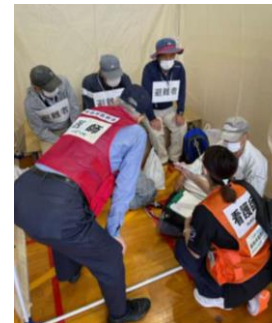
医師会・看護協会 による巡回診療