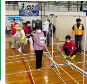
住民主体の 避難所設営