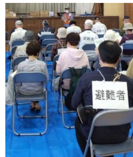
看護協会による衛生教育 防災士による防災教育