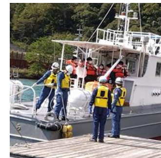
孤立地区からの 海上避難