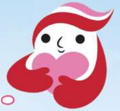
犯罪被害者等支援シンボルマーク 「ギョットちゃん」