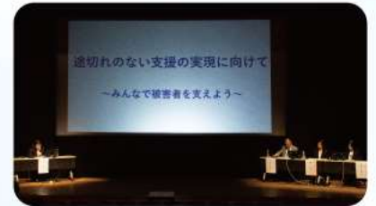
● パネルディスカッション