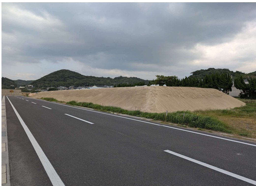
シート被覆前状況