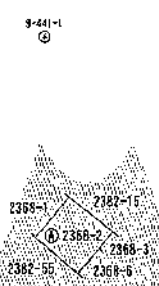
国道9号基準点(管理標)の名称・座標値・種類 世界測地系