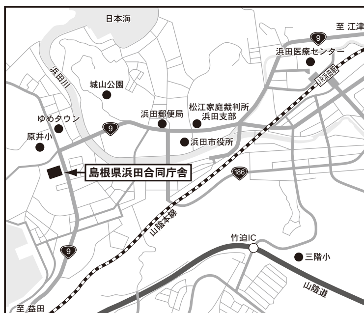
浜田試験場案内図

〔島根県職員会館〕※第2次試験会場 ・JR山陰本線松江駅から 一畑バス「松江しんじ湖温泉」行き 松江市営バス「大学・川津」行き 「県庁前」下車 徒歩約5分 ・一畑電鉄松江しんじ湖温泉駅から 徒歩約20分