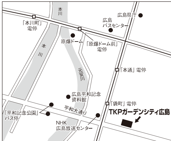
広島試験場案内図

ただし、障がい等のため自家用車による来場が必要である場合は、事前に島根県人事委員会事務局企画課任用グループまでご連絡ください。また、近隣商業施設への無断駐車はご迷惑となりますので、絶対におやめください。