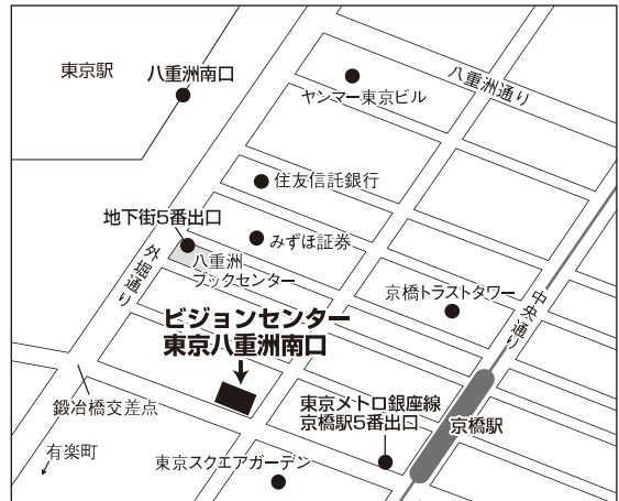
東京試験場案内図

住 所：広島市中区中町8-18 広島クリスタルプラザ2F、3F アクセス：広島電鉄宇品線「袋町駅」より徒歩3分