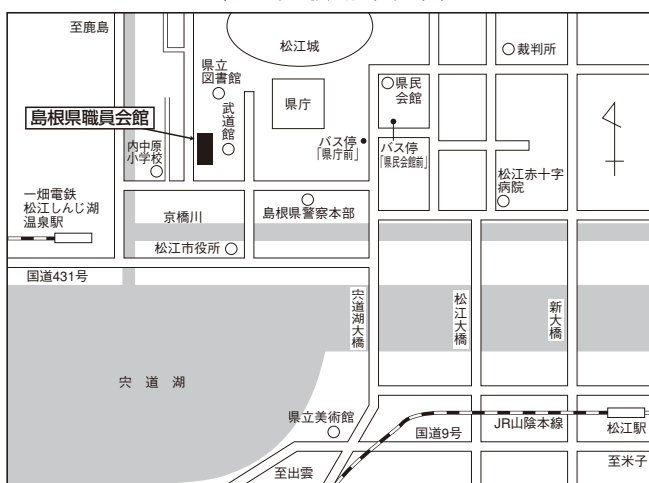
松江試験場案内図