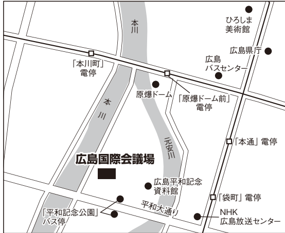
広島試験場案内図

ただし、障がい等のため自家用車による来場が必要である場合は、事前に島根県人事委員会事務局企画課任用グループまでご連絡ください。また、近隣商業施設への無断駐車はご迷惑となりますので、絶対におやめください。