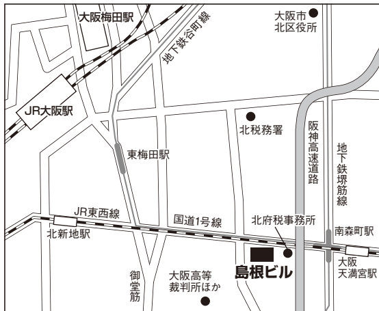
大阪試験場案内図