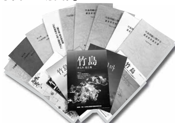
「竹島に関する啓発資料の作成・配布」

県では、「産業の振興」、「自然環境の保全」、「医療・福祉の充実」、「教育・文化の振興」、「子どもの読書活動の促進」、「竹島の領土権の確立」、「森林の保全及び整備」、「防災対策の推進」のための事業に活用しています。