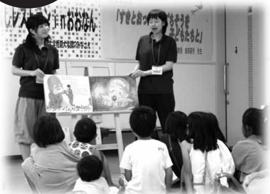
「子ども読書フェスティバルの開催」