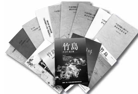
「竹島に関する啓発資料の作成・配布」

県では、「産業の振興」、「自然環境の保全」、「医療・福祉の充実」、「教育・文化の振興」、「子どもの読書活動の促進」、「竹島の領土権の確立」、「森林の保全及び整備」、「防災対策の推進」のための事業に活用しています。