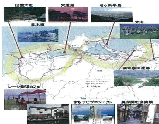
『人間文化の原風景～ご縁をつなぐ神仏の通ひ路』