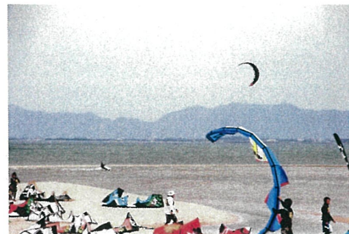
安来市飯梨川河口

※カイトボード： 専用のカイト(帆)を用いて、ボードに乗った状態で水上を滑走するウォータースポーツ