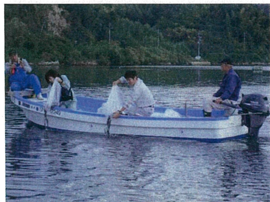
ウナギの稚魚放流