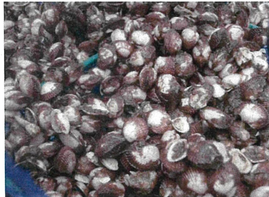
養殖試験中のサルボウ稚貝