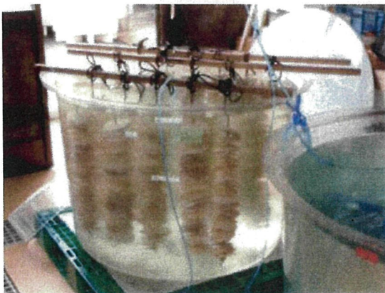
サルボウガイの人工種苗の生産