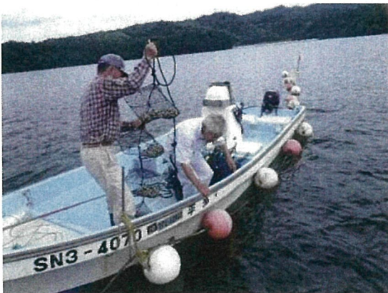
サルボウガイのカゴ養殖