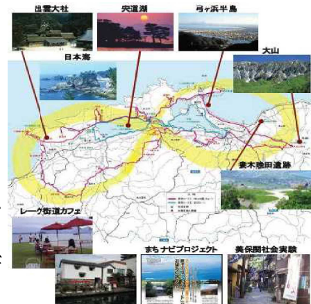
『人間文化の原風景～ご縁をつなぐ神仏の通ひ路』