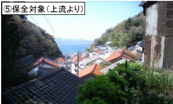
⑤保全対象(上流より)