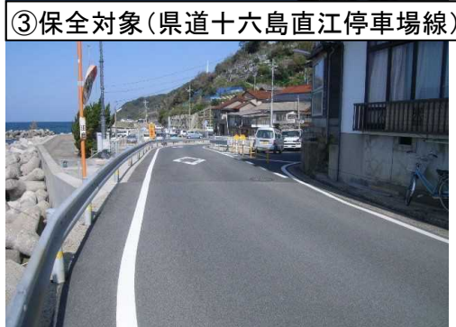
③保全対象(県道十六島直江停車場線)