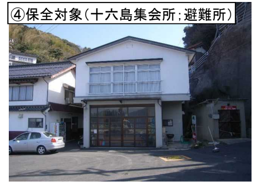
④保全対象(十六島集会所;避難所)