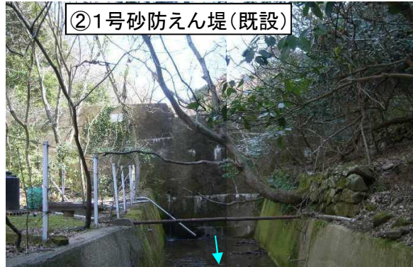
②1号砂防えん堤(既設)