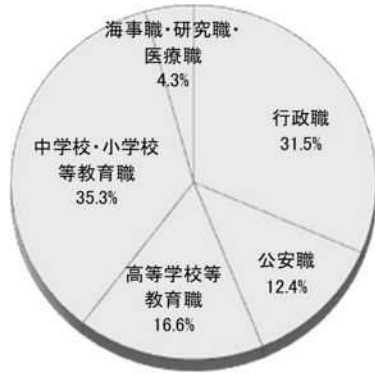
給料表別職員構成比