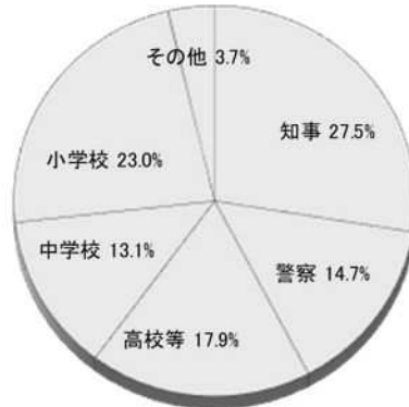
部局別職員構成比