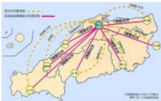
移動時間の大幅な短縮効果