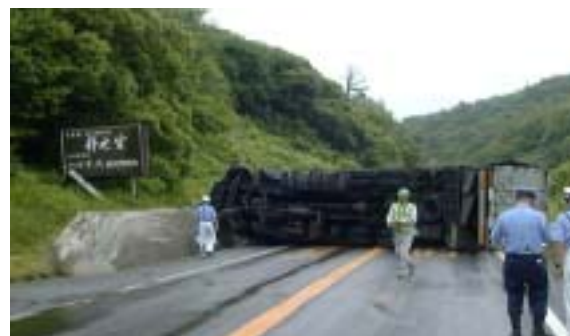
事故・災害時の代替道路として機能